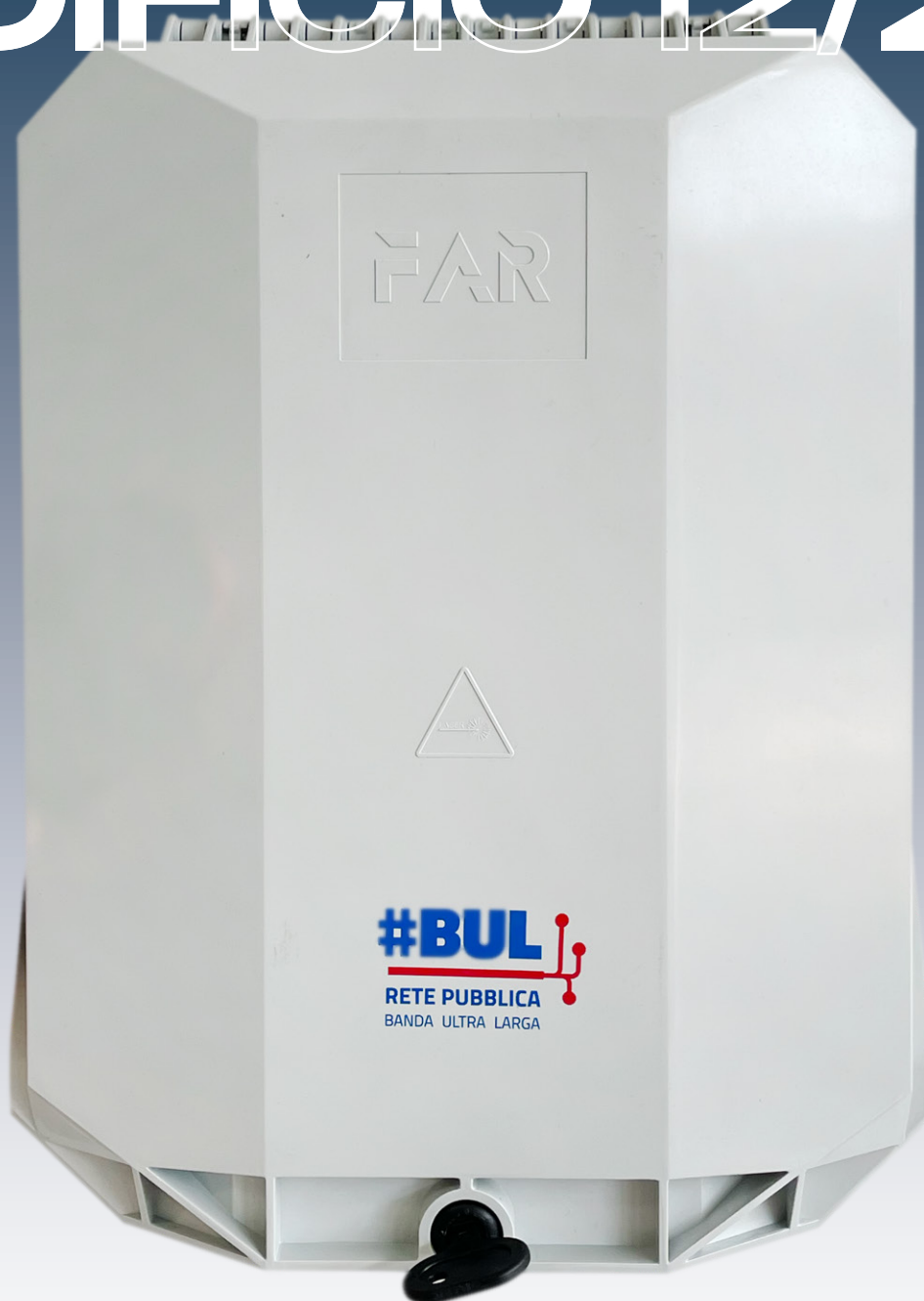
ROE EDIFICIO 12/24