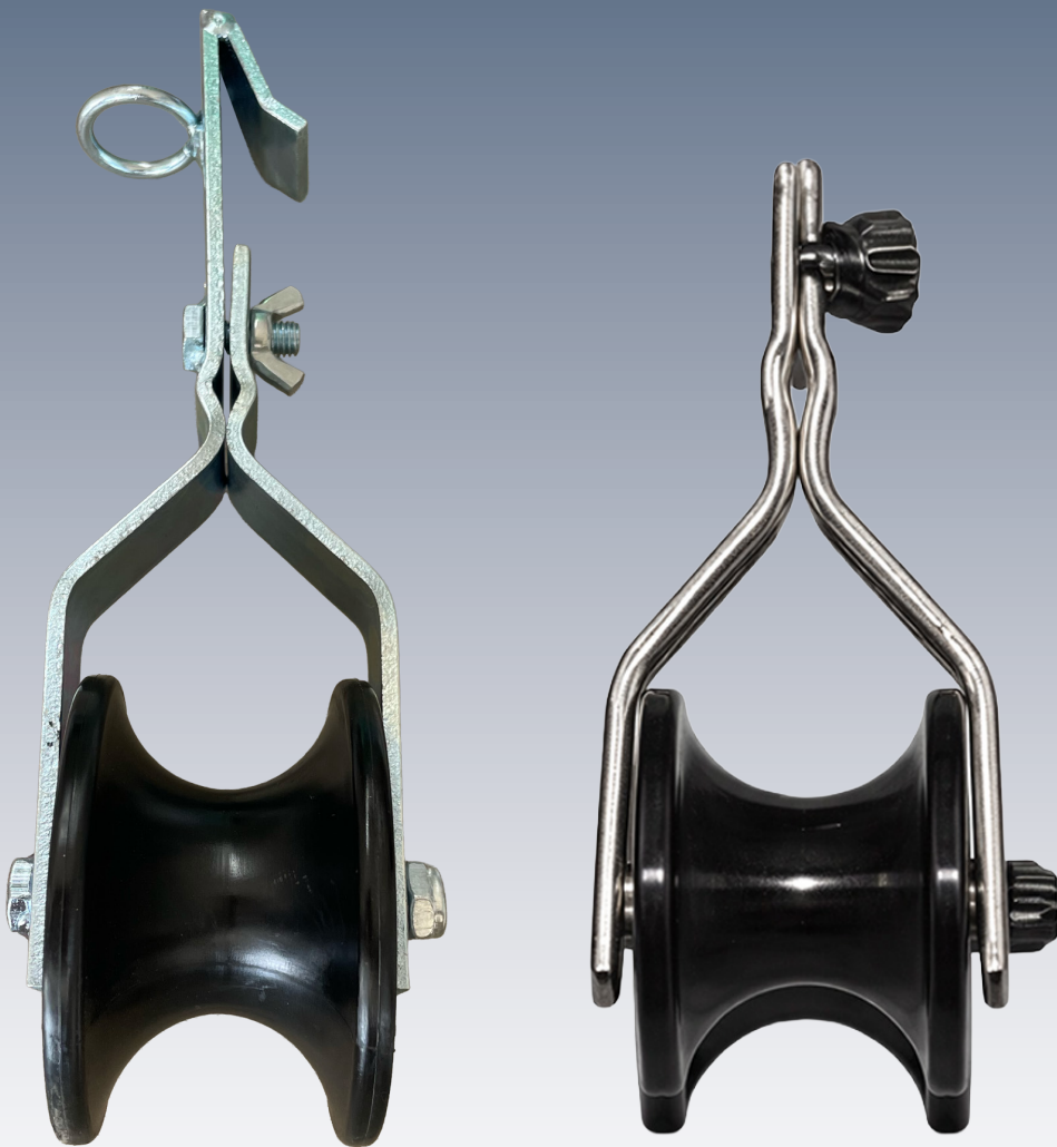
CARRUCOLE STENDICAVO PER LA POSA DI CAVI TELEFONICI